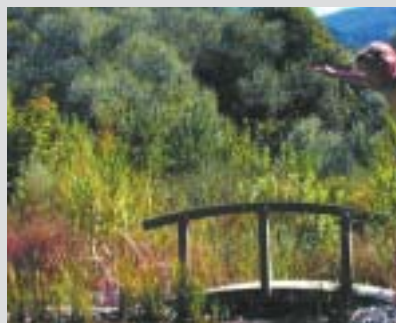
Ils présentent un risque environnemental minimal.