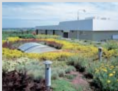
Ils présentent des avantages tant écologiques qu'économiques.