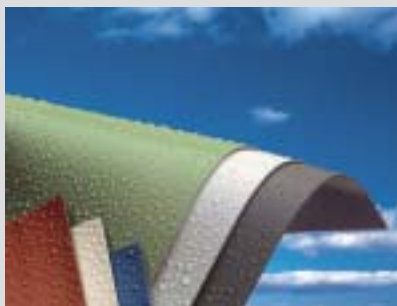
Ils sont durables et recyclables.